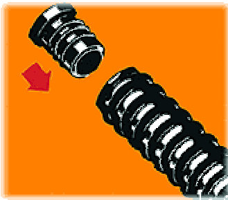
Gummi in Rohr schieben