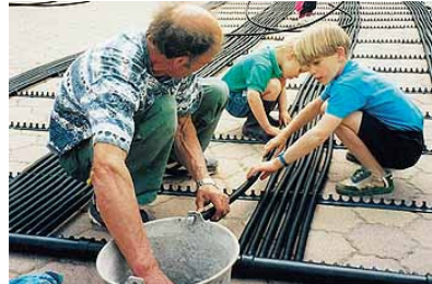
Verteilen der Haltebügel und ablängen der Rohre