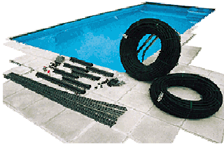
Ausbreiten des Materials und lesen der Anleitung