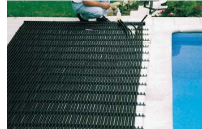
Rohre einclipen und auf den Kollektor stecken