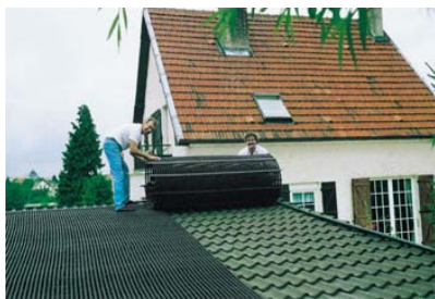
Kollektoren einrollen und an definitiven Ort bringen. Zusammenkleben und Verrohrung machen