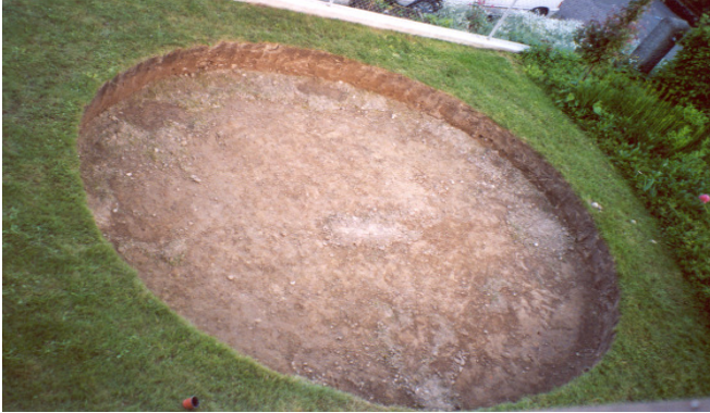
Humus ausstechen (ca. 30 cm) und erstellen des Aushubes