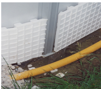
Sickerleitung um den Pool wenn der Untergrund lehmig und damit wasserundurch- lässig ist