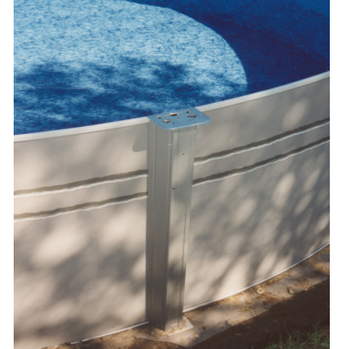
Montieren der oberen Wandführung und Stützen