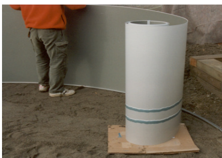
Einfahren der Wand in die Bodenschienen