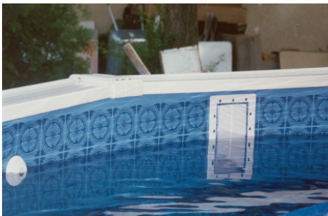
Wasser einfüllen und Sitzrand montieren. Installieren Skimmer und Düse