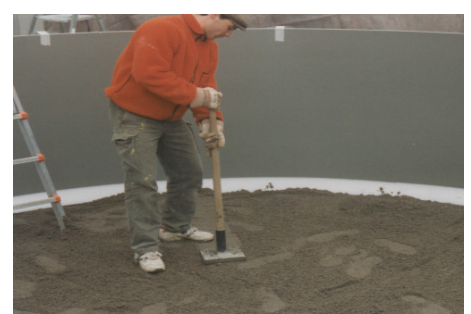
Einringen von Schlemmsand