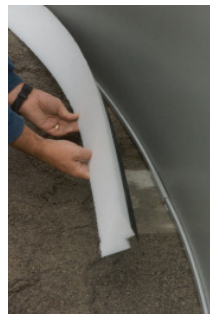
Montieren der Keilprofile