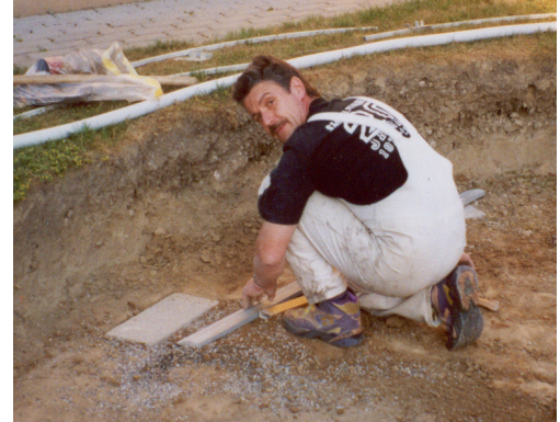
Verlegen der Gartenplatten bei jeder Vertikalstütze