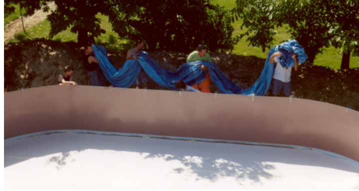
Die Folie kann nun ins Becken gehängt werden