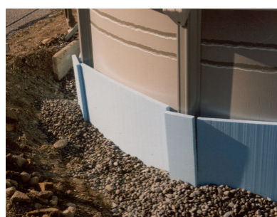
Isolieren Becken im Erdreich