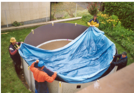
Einhängen der Folie