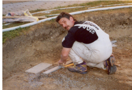
Verlegen der Gartenplatten bei jeder Vertikalstütze