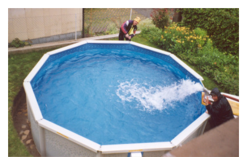
Wasser einfüllen und montieren des Sitzrandes