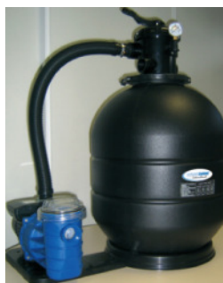
Zusammenbau Filter- anlage