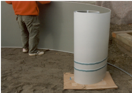
Einfahren der Wand in die Bodenschiene