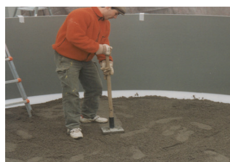
Einbringen von Schlemmsand und verdichten