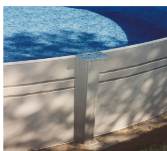
Montieren der oberen Wand- führung und der seitlichen Stützen