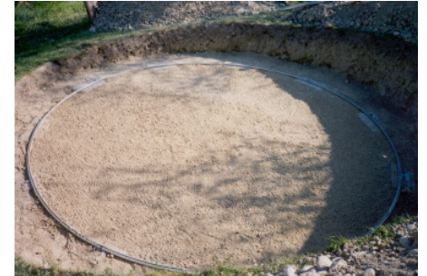
Zusammenstecken des Bodenrings