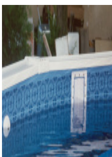
Installieren Skimmer und Düse