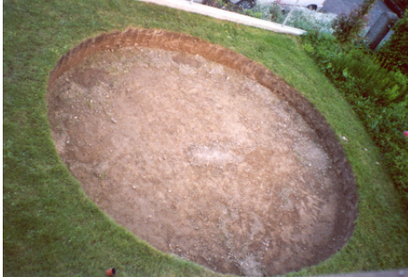
Humus ausstechen (ca. 30 cm) und erstellen des Aushubes